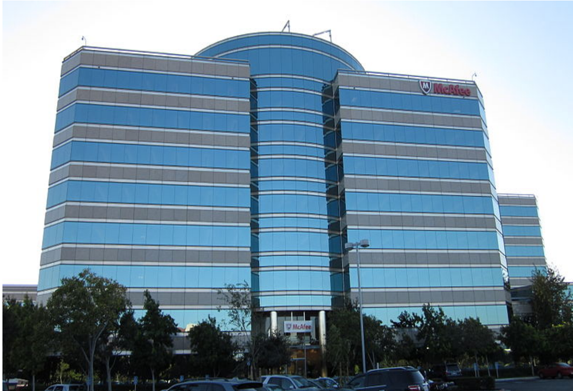
Штаб-квартира McAfee в Санта-Клара, Калифорния